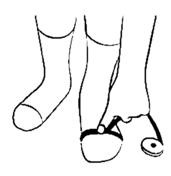
3. To measure the width of the foot, locate the widest part of it. Surrounding all the foot with a measuring tape, obtain the width of the foot.