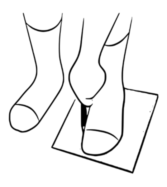
1. Place a sheet of paper on the floor, stepping your foot on it, making sure you are wearing the socks you would be using with the shoes you are going to purchase. Draw on the paper the contour of your foot using a pencil.